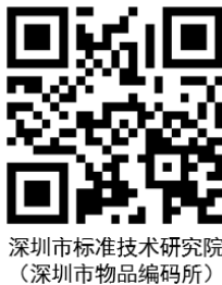
图A. 7 名称+统一代码的二维条码展示