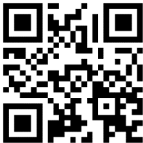
图A. 5 统一代码的二维条码展示