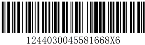
图A. 4 统一代码的一维条码展示