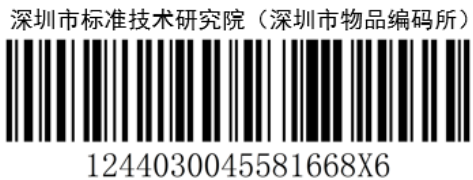
图A. 6 名称+统一代码的一维条码展示