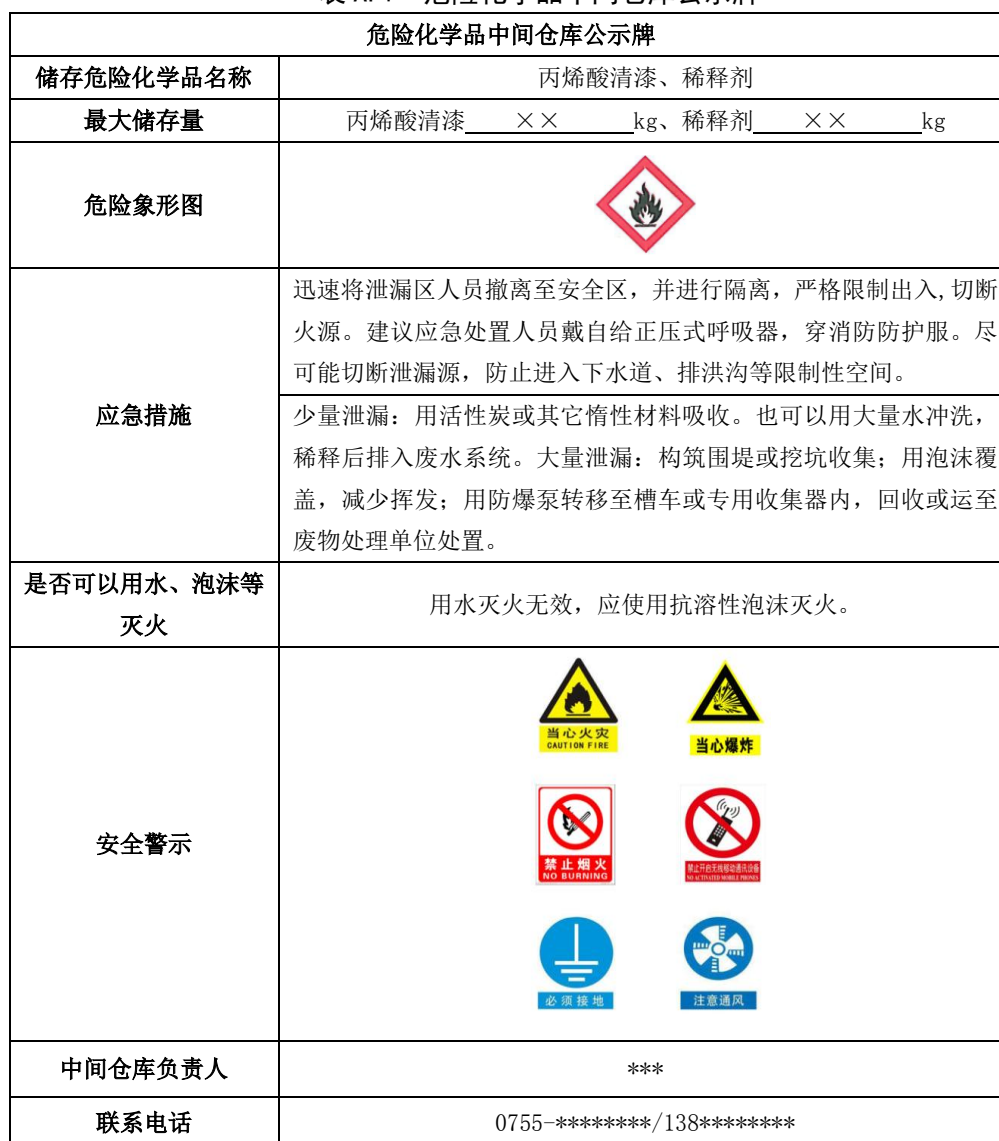
表 A.1 危险化学品中间仓库公示牌