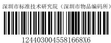
图A.6 同时标注名称与统一社会信用代码的一维条码展示