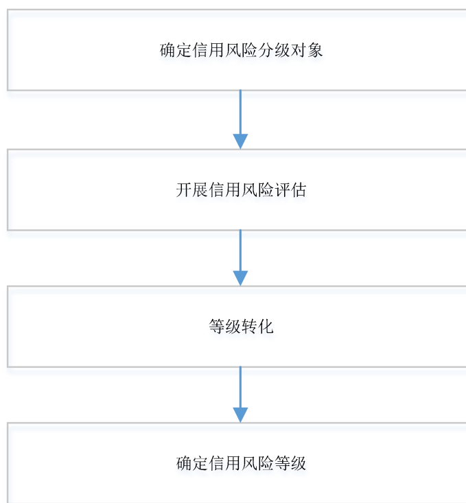
图 2 定级流程

结合企业分类类型和标签，确定企业信用风险分级对象，识别特征。选用信用风险分级模型对企业开展信用风险评估，得出企业信用风险评估分值，并按照一定的规则转化成企业信用风险等级。在此基础上，结合企业信用风险特征，对满足一定风险特征的企业，按一定规则调整后确定信用风险等级，具体定级流程见图 2。