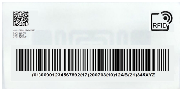
图9 包含UDI-DI和UDI-PI（失效日期、生产批号和序列号）的RFID标签