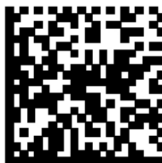
图6 包含UDI-DI和UDI-PI（失效日期和生产批号）的GS1 DataMatrix码

(01)06901234567892 (17)201231 (10)1234AB (21)5678CD