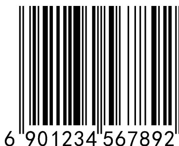
图 1 仅包含 UDI-DI 的 EAN-13 码

GS1 标准的 UDI 数据载体有三种形式，分别是一维条码 (EAN-13、GS1-128、ITF-14、GS1 DataBar)、二维条码 (GS1 DataMatrix) 和 RFID，常见 UDI 载体示例见图 1 至图 8，ITF-14 示例见 GB/T 16830—2008 附录 B 和附录 C。