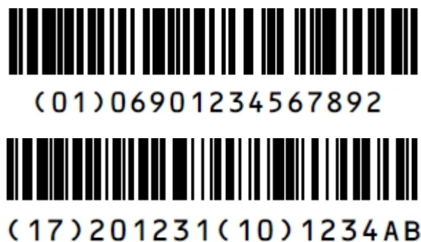
图 3 包含 UDI-DI (上) 和 UDI-PI (失效日期和生产批号) (下) 并联的 GS1-128 码