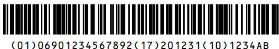
图 2 包含 UDI-DI 和 UDI-PI (失效日期和生产批号) 串联的 GS1-128 码