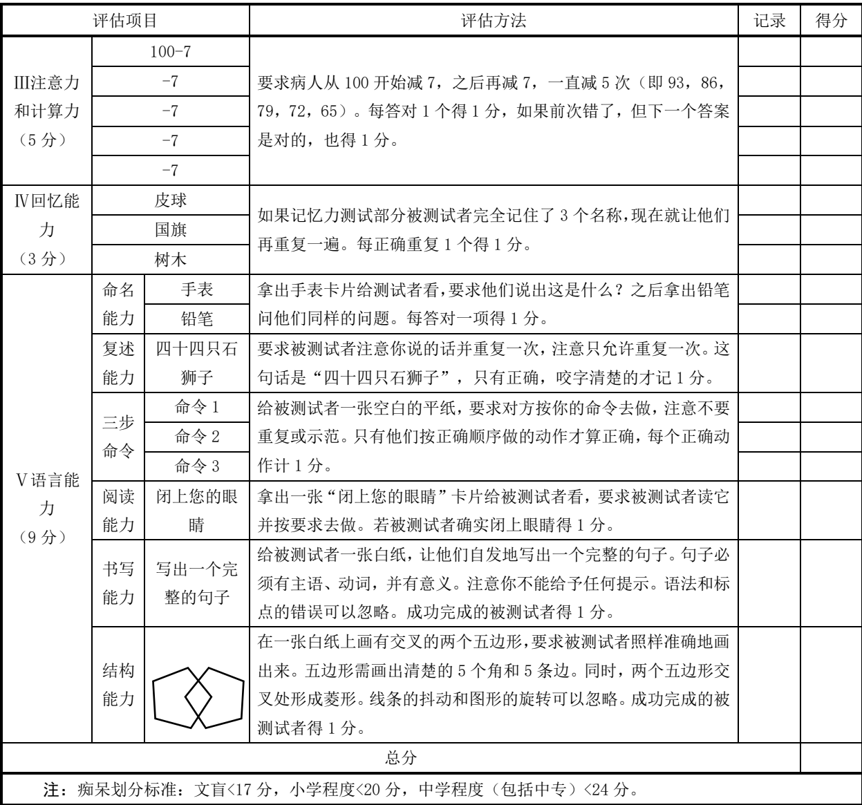
表 A.7 简易精神状态评价量表（MMSE）（续）