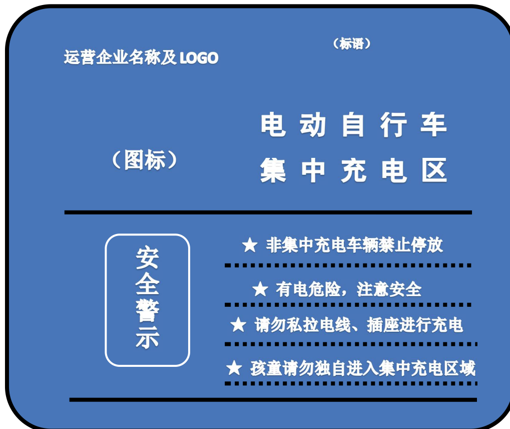
图 B.2 集中充电设施标识图示