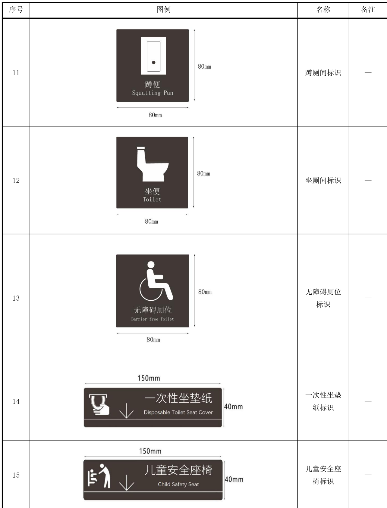
表 A.1 公共厕所标识与指引系统图例（续）