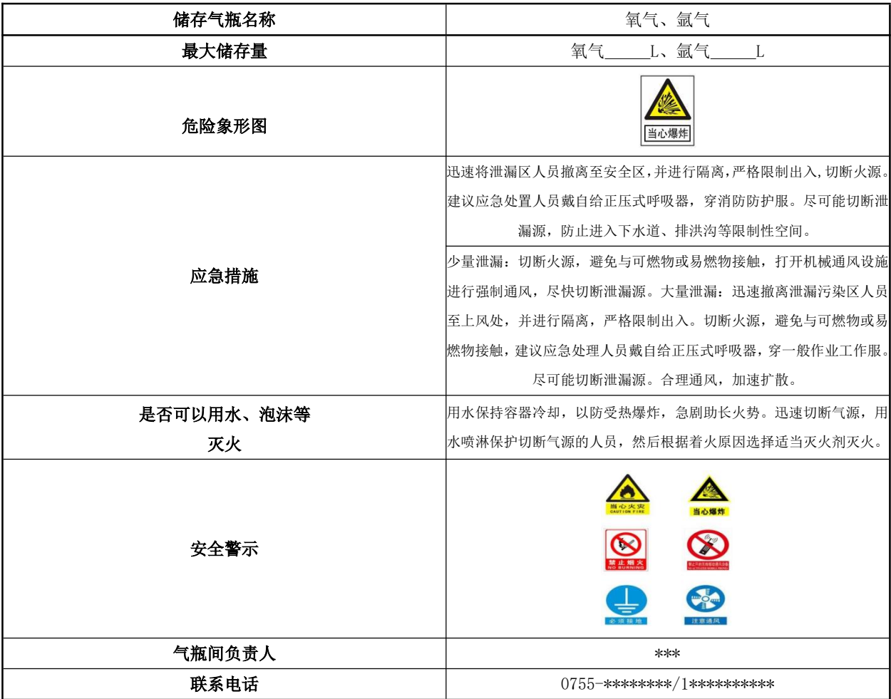
表 A.1 实验室气瓶间公示牌