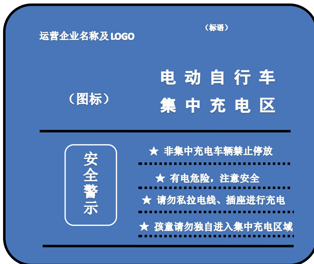
图 B.2 集中充电设施标识图示