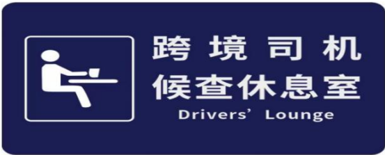
图 D.16 跨境司机候查休息室标志示例图

D.4.1 地面交通信息标志包括跨境学童候车点标志、跨境学童集合点标志、入境大客车上客区标志、入境小汽车上客区标志、入境巴士上客区标志等。