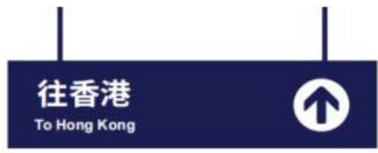
图 D.9 出境大厅灯箱标志示例图