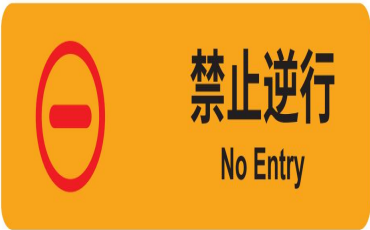
图 D.5 禁止逆行标志示例图

D.1.3.1 口岸大楼出境层各入口处设置位置及指引标志，包括登机口标志、国际/港澳台出发标志、出境大厅灯箱标志、出境厅楼层位置标志及出境指引标志等。