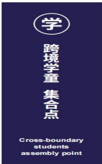
图 D.18 跨境学童集合点标志示例图