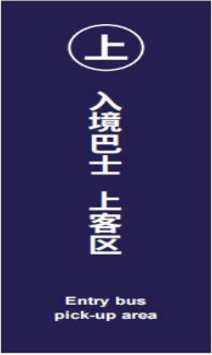
图 D. 21 入境巴士上客区标志示例图