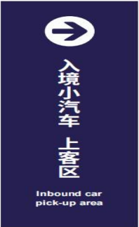
图 D. 20 入境小汽车上客区标志示例图