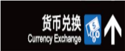
图 D. 14 货币兑换标志示例图

D. 3. 1 进行货检的口岸，设置货检区域标志，包括禁止通行标志、跨境司机候查休息室标志。