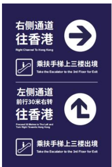
图 D.11 出境指引标志示例图

D.2.1 口岸大楼内信息标志设置时考虑抵离口岸的人员，标志包括口岸大楼前指引标志、离境退税标志和货币兑换标志等。