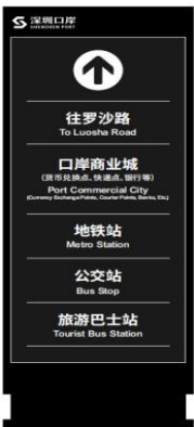
b) 通道、连廊立牌落地指引标志