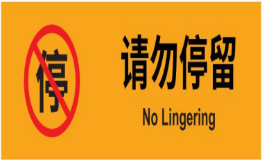
图 D.4 请勿停留标志示例图