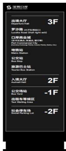
a) 口岸大楼指引立牌落地标志