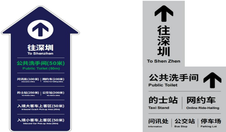
图 D.2 往深圳标志示例图