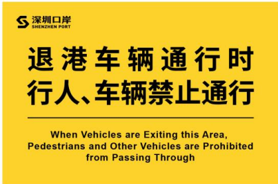
图 D. 15 货检区域禁止通行标志示例图