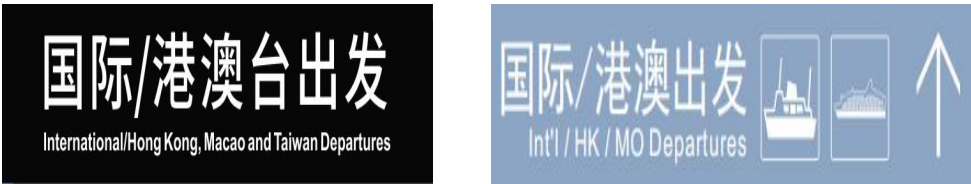
图 D.6 国际/港澳台出发标志示例图