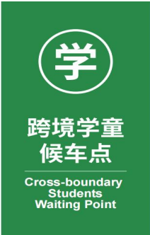
图 D.17 跨境学童候车点标志示例图