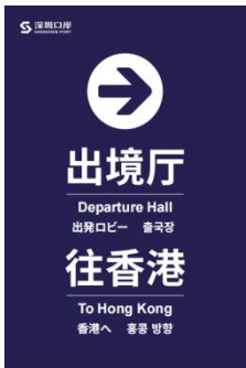
图 D.10 出境厅楼层位置标志示例图