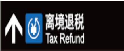
图 D. 13 离境退税标志示例图