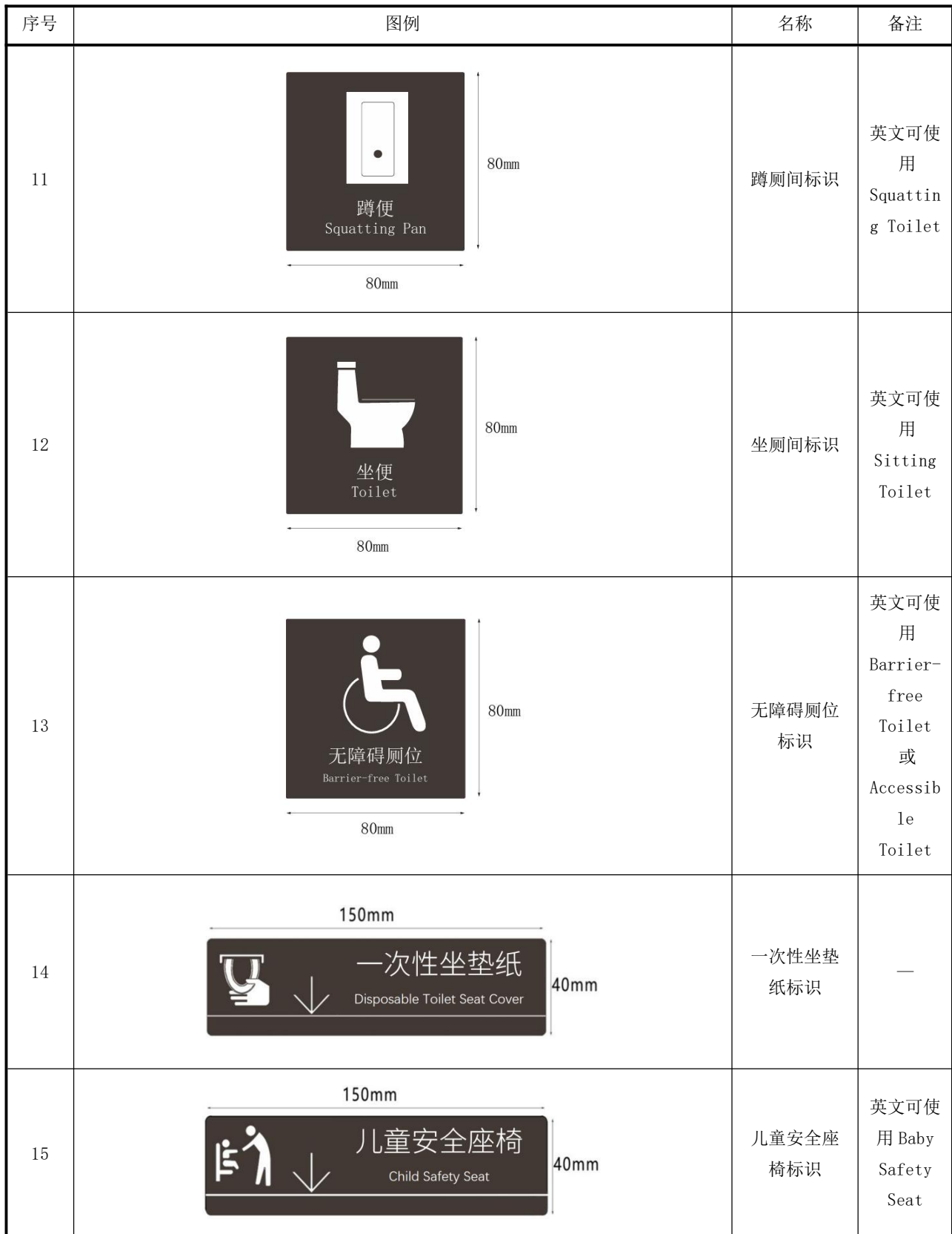
表 A.1 公共厕所标识与指引系统图例（续）