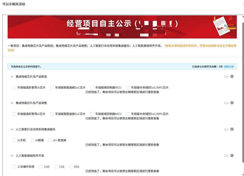
特色经营项目预览页面示意图

进入经营范围特色经营项目申报页面，可查看本经营主体经营范围项下特色经营项目清单和及其详细内容。